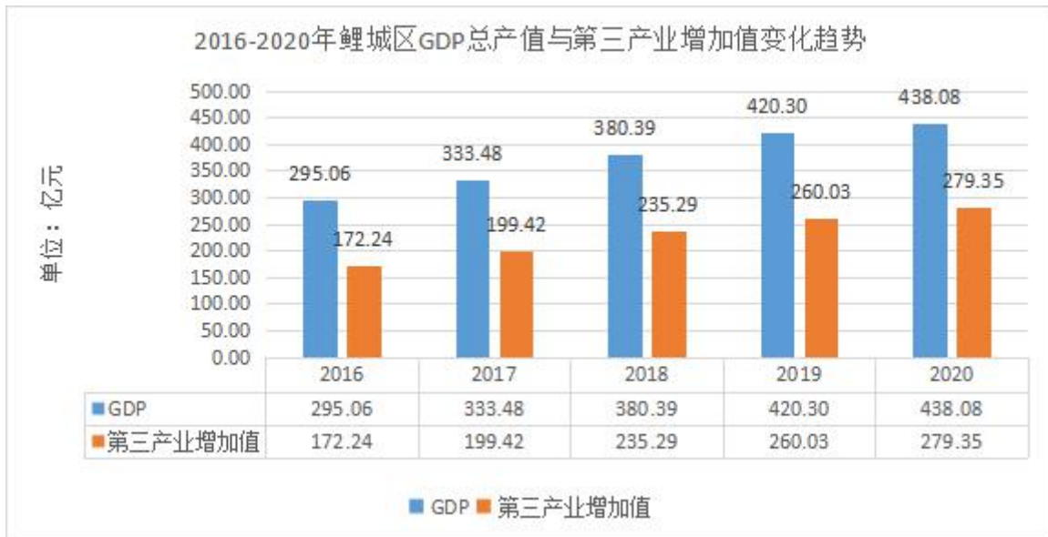
图 1：鲤城区 2016-2020 年 GDP 与第三产业增加值增长趋势图

区域经济整体发展平稳，增长趋势相对稳定。“十三五”以来，鲤城区地区生产总值由 2015 年的 265.99 亿元增加至 2020 年的 438.08 亿元，年均增长 7%。其中，2020 年第三产业增加值实现 279.35 亿元，“十三五”期间年均增长 7.7%，占 GDP 比重达 63.77%，较 2015 年提高 7.16 个百分点；税收达 9.43 亿元，占全区纳税大户税收比重达 50.2%。经济的平稳发展，为鲤城区“十四五”期间现代服务业的快速发展提供了巨大的发展潜力。